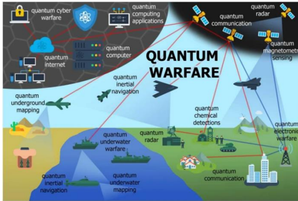
Figura 1, Possibili applicazioni militari delle tecnologie quantistiche.

Le tecnologie quantistiche hanno il potenziale per influenzare profondamente molti settori dell'attività umana, in particolare quello della difesa, dove accresceranno la sensibilità e l'efficienza degli strumenti, introducendo nuove capacità e affinando le tecniche di guerra moderna. Come illustrato nella Figura 1, le possibili applicazioni della tecnologia quantistica per la difesa, la sicurezza, lo spazio e l'intelligence in diversi aspetti del new warfare sono estremamente numerose. Tuttavia, è importante considerare che molte applicazioni sono ancora più teoriche che realistiche.